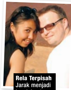
Rela Terpisah Jarak menjadi kendala utama