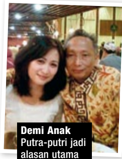
Demi Anak Putra-putri jadi alasan utama