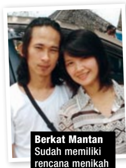
Berkat Mantan Sudah memiliki rencana menikah

“Tidak lama lagi kami berencana bertunangan”